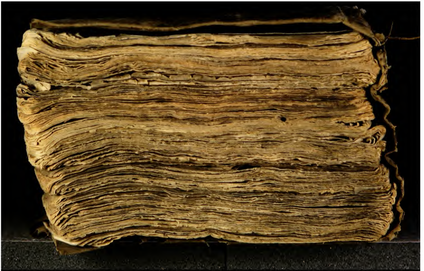
Early European Books, Copyright © 2009 ProQuest LLC. Images reproduced by courtesy of the Royal Library, Copenhagen. LN 588 8°